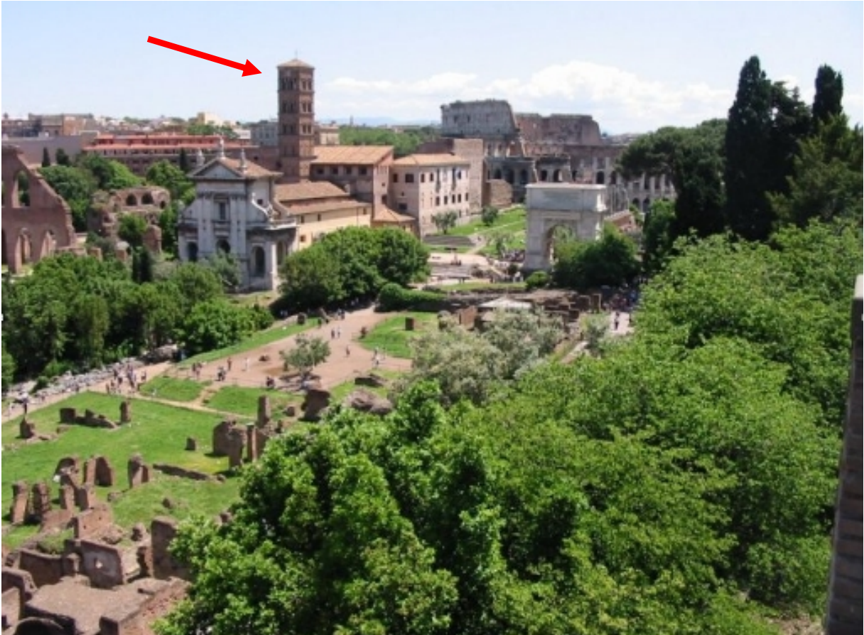
Das Forum Romanum mit Titusbogen und Kolosseum im Hintergrund